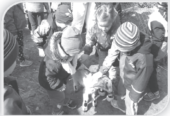
Na návšteve pri zvieratkách