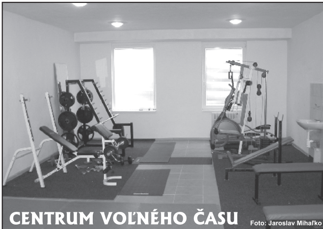
CENTRUM VOĽNÉHO ČASU

Hlavným prínosom týchto zmien by malo byť vzbudenie záujmu širokej verejnosti, najmä mládeže o aktívnu realizáciu sa v športovej činnosti, podanie návrhu na vytvorenie vhodných podmienok v požadovaných oblastiach športu a využívanie momentálnych priestorov k športovej aktivite.