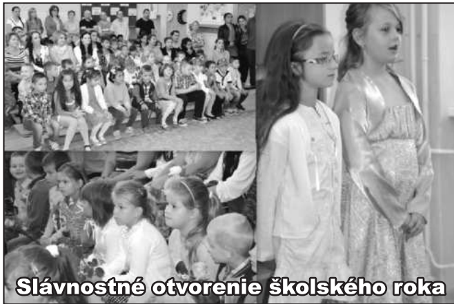
Slávnostné otvorenie školského roka

Dňa 5. septembra sme začali školský rok 2016/2017. Pri slávnostnom otvorení, za prítomnosti pána starostu a členiek Jednoty dôchodcov Slovenska v Brekove, sme nezabudli na našich minuloročných štvrtákov, ktorí sa nám rozpráhli do piatich ročníkov. Pevne veríme, že sa im tam bude dariť aspoň tak dobre ako v našej základnej škole.