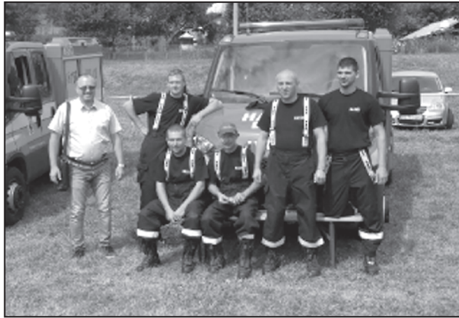
Súťažiaci Brekovský DHZ v obci Zboj