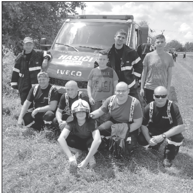
Taktické cvičenie pri Laborci v Humennom

Že sa mládeži oplatí aktívne venovať, potvrdilo umiestnenie našich mladých hasičov, ktorí spomedzi 18 mužstiev